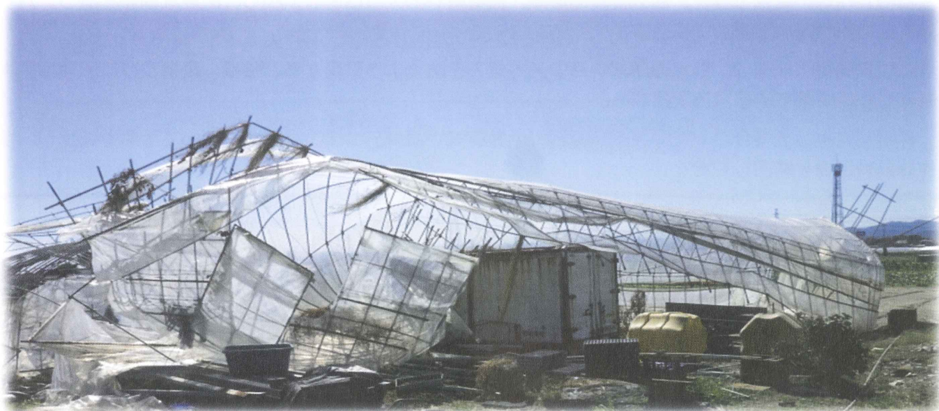
台風24号による県内の被害（本庄市）