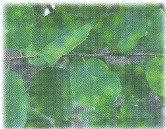
▲ 症状が似ている他の病害(うどんこ病)