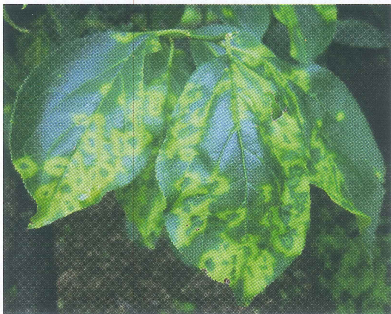
▲ 感染したウメの葉の症状①