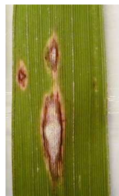
写真3 葉いもちの慢性型病斑