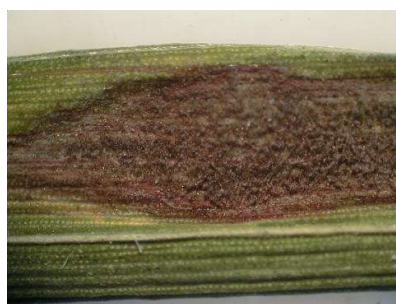
写真2 葉いもちの進展型病斑 (灰色の胞子がみられる)