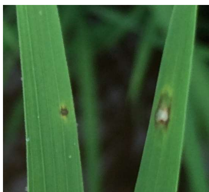
写真1 葉いもち初期病斑 (褐色の点)