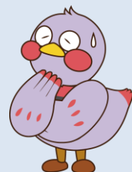
埼玉県マスコット 「さいたまっち」

※ 意識障害（受け答えがおかしい、意識がない）がある場合や、症状が回復しない場合は、迅速に医療機関を受診して下さい。